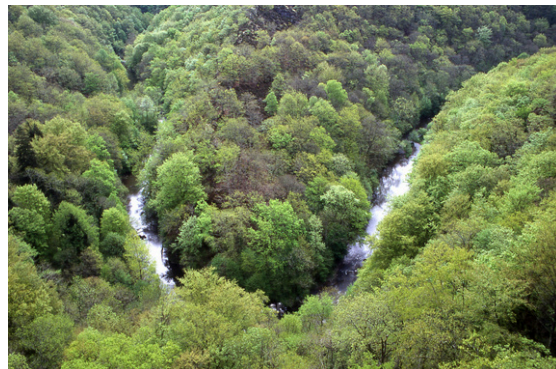
Méandre du Viaur

Pour permettre la mise en place d'une gestion durable des espaces naturels au sein du réseau, la France a opté pour une politique volontaire et contractuelle . Il n'y a pas de contraintes réglementaires spécifiques en dehors de l'évaluation des incidences, qui est un dispositif réglementaire, prévu par le code de l'environnement, permettant de s'assurer que certains projets importants (liste fixée par arrêté) ne sont pas susceptibles d'avoir un impact négatif sur les milieux naturels, les habitats, les espèces végétales et animales ayant justifié la désignation du site Natura 2000.